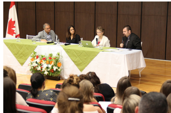
II Encontro Internacional de Justiça Restaurativa do Poder Judiciário - fevereiro/2018