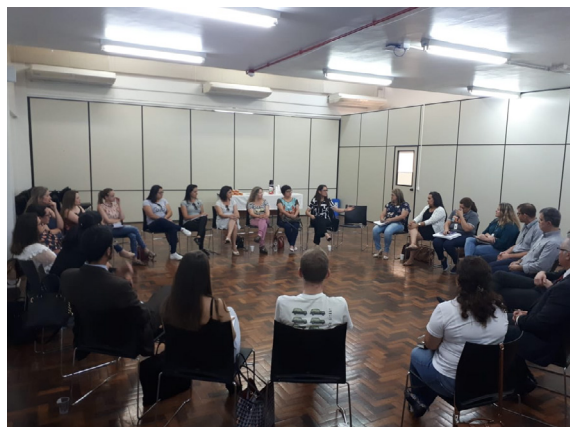
Reunião da Equipe Técnica do Programa - Região Centro-Norte (Caçador) - 26/11/2018