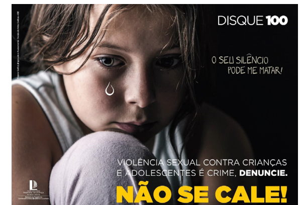
Cartaz distribuído pela CEIJ às comarcas do Estado