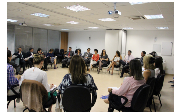
1ª Reunião Ordinária do Conselho Consultivo de Juízes da CEIJ. Abril/2018