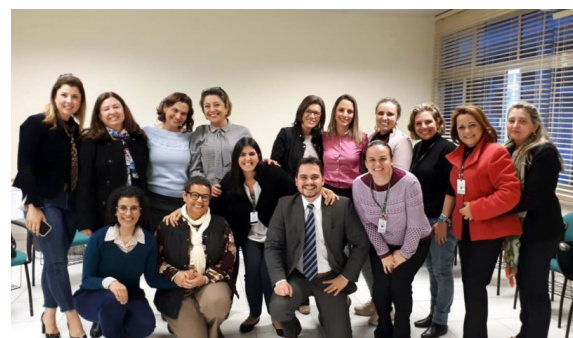
Reunião da Equipe Técnica do Programa - Região Sudeste Sesi São José - 30/07/2018

Questões técnicas de planejamento e operacionalização são tratadas periodicamente, nas reuniões locais e regionais. Nos encontros regionais, denominados de reuniões técnicas, participam responsáveis e corresponsáveis, magistrados das comarcas e membros da equipe da CEIJ, além de representantes da FIESC e das demais entidades parceiras do Programa.