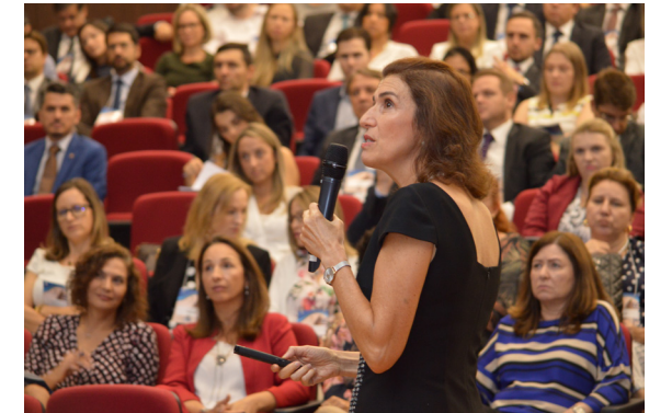
Curso de Capacitação: Atuação dos magistrados no contexto do depoimento especial com crianças e adolescentes 1ª Etapa - março/2018

(Módulo introdutório do curso Capacitação para multiplicadores: DE com crianças e adolescentes)