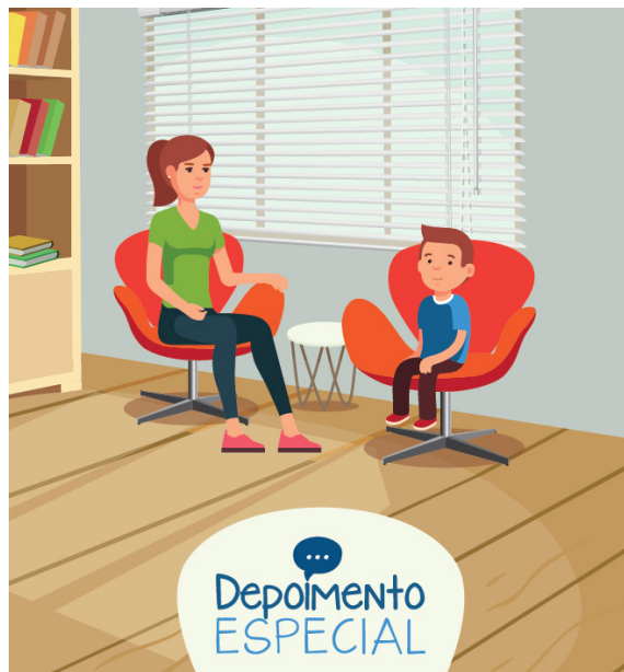
Identidade visual criada pela Divisão de Artes Gráficas, do TJSC, em razão do Seminário Interinstitucional sobre o Depoimento Especial: a Lei n. 13.431/2017 e seus desdobramentos em Santa Catarina - realizado em abril/2018

Em razão da promulgação da Lei n. 13.431, de 04 de abril de 2017 , que estabelece o sistema de garantia de direitos da criança e do adolescente vítima ou testemunha de violência, a CEIJ foi designada como unidade responsável pela estruturação do Depoimento Especial nas comarcas de Santa Catarina. Assim, juntamente com a Academia Judicial, a Corregedoria e demais diretorias deste Tribunal de Justiça (Diretoria de Tecnologia da Informação-DTI, Diretoria de Engenharia e Arquitetura - DEA, Diretoria de Material e Patrimônio - DMP, Diretoria Geral Administrativa - DGA), envia esforços para a implantação do Depoimento Especial de forma gradual e articulada, considerando os principais aspectos previstos na referida legislação: