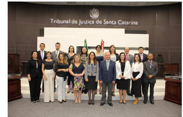
XIII Encontro do Colégio de Coordenadores - novembro/2018

https://portal.tjsc.jus.br/web/sala-de-imprensa/-/especialistas-debatem-aspectos-da-nova-lei-de-adoacao-em-vigor-desde-novembro-de-2017