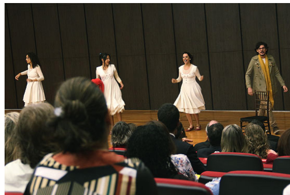
Apresentação do teatro "Marcas da Infância" - Projeto Eu tenho Voz - realizada no Seminário sobre Combate à Violência Sexual contra crianças e adolescentes - maio/2018

A CEIJ, a partir da perspectiva da implementação de ações para enfrentar a violência sexual contra crianças e adolescentes, elaborou a cartilha " Os Super Adultos de Confiança ", em parceria com a Divisão de Artes Gráficas - DAG, deste Tribunal.