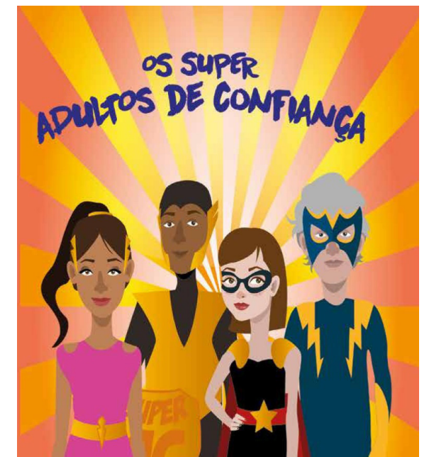
Cartilha: Os Super Adultos de Confiança

https://portal.tjsc.jus.br/web/sala-de-imprensa/-/servidora-da-justica-explica-a-professores-como-identificar-sinais-de-abuso-sexual