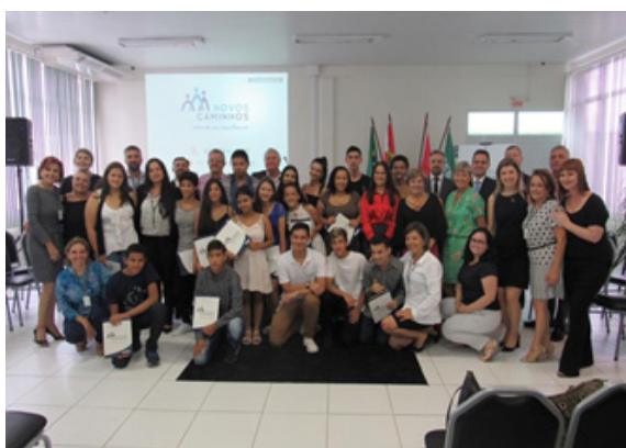
Formatura Região Sudeste (Grande Florianópolis) - 28/11/2018